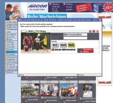
Bestellauswahl: Format, Preis