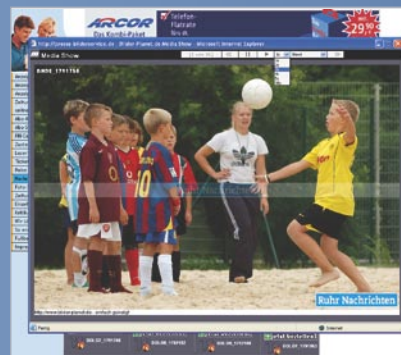
Slideshow Ruhrnachrichten – Bildordner Dortmund Stadt