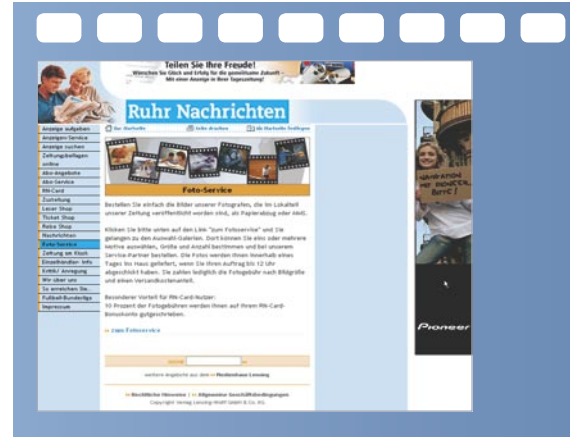
Ankündigung Foto-Service auf www.ruhrnachrichten.de

tem Download ab. Nachdem der User „jetzt bestellen“ geklickt hat, öffnet sich ein zusätzliches Fenster, das ihm die Möglichkeit der Bildgrößen-Auswahl gibt (Bild 7). Infolge der Flexibilität und Vielseitigkeit des Presse-Bilderservice kann der Verlag verschiedene Formatgrößen anbieten. Die Preisgestaltung wird gemeinsam abgestimmt. Mouseover-Hilfetexte machen den Service selbst für ungeübte Nutzer einfach und unkompliziert.