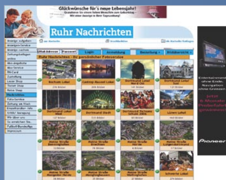
Übersicht Fotoalben – Lokalausgabe