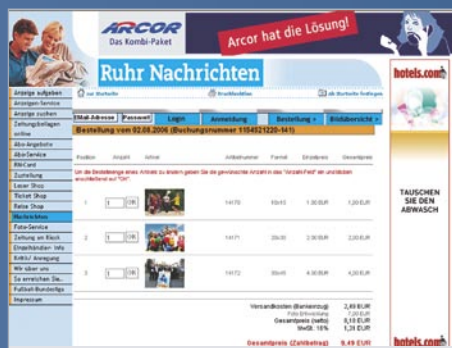
Bestellübersicht nach Bildauswahl