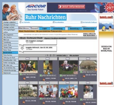
Tagesbildübersicht Ruhrnachrichten – Lokalausgabe Dortmund Stadt